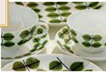
Stig Lindbergs servis Berså är en riktig Gustavsbergsklassiker.