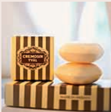
Cremosintvålen – en kunglig favorit.